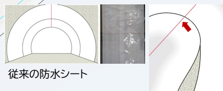
従来の防水シート